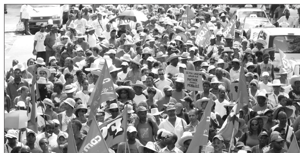
Une marée humaine qui a secoué le pays, comme un cyclone. Le mouvement social de 2009, devenu crise sociétale pour les autorités et les experts, a pris tout le monde de court. Il faut autant de ressources pour y faire face.