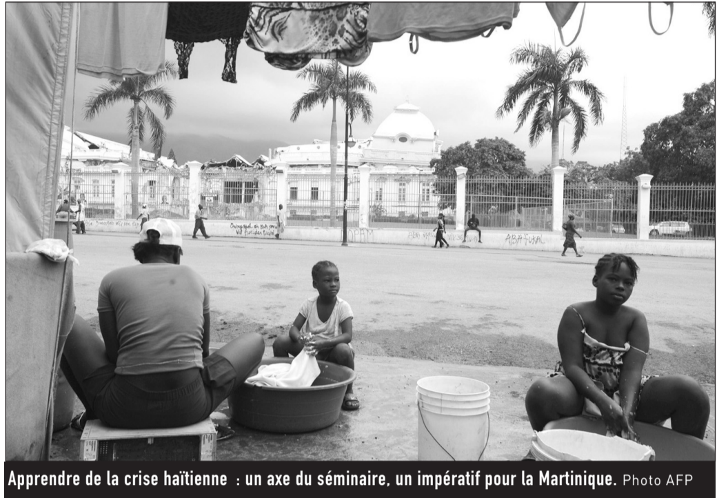
Apprendre de la crise haïtienne : un axe du séminaire, un impératif pour la Martinique.